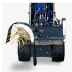
Spollonatrice per trinciatrice (su richiesta: spazzola azionabile anche individualmente)