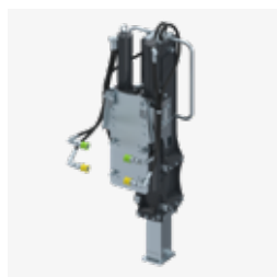
Sistema di sgancio rapido dell'albero telescopico