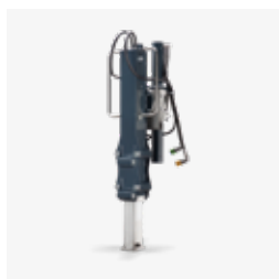
Sistema rotante con albero telescopico 500 mm