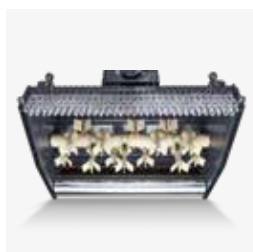
Trinciatrice mod. SM90 con larghezza di lavoro 90 cm