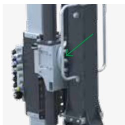
Sistema di rotazione rapida a 180°