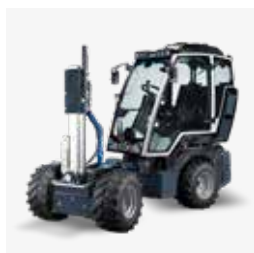
Albero portattrezzi con distributori idraulici e funzioni idrauliche aggiuntive