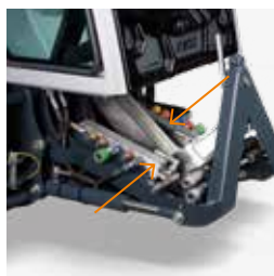
Hydraulikblock mit 12V-Steckdose