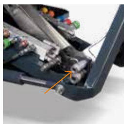
Anschlüsse an die zweite Zahnradpumpe