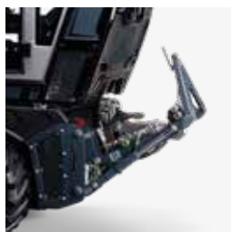
Front-Hubwerk mit Kupplungsdreieck Kat. 0